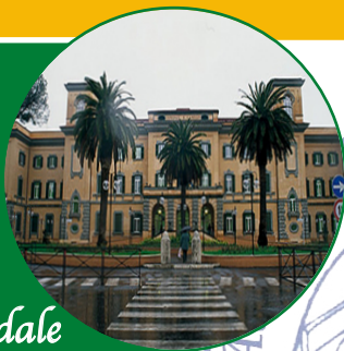
Ospedale S. Camillo