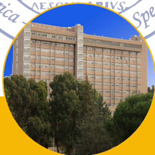
Ospedale S. Eugenio

Venti anni di Trapianti di Fegato del POIT