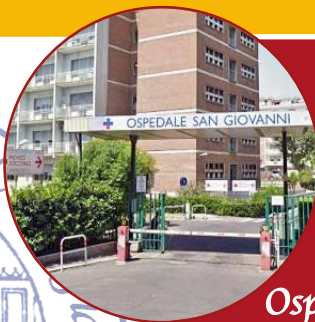
Ospedale S. Giovanni