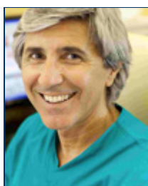
Presidente Luigi Piazza - Catania