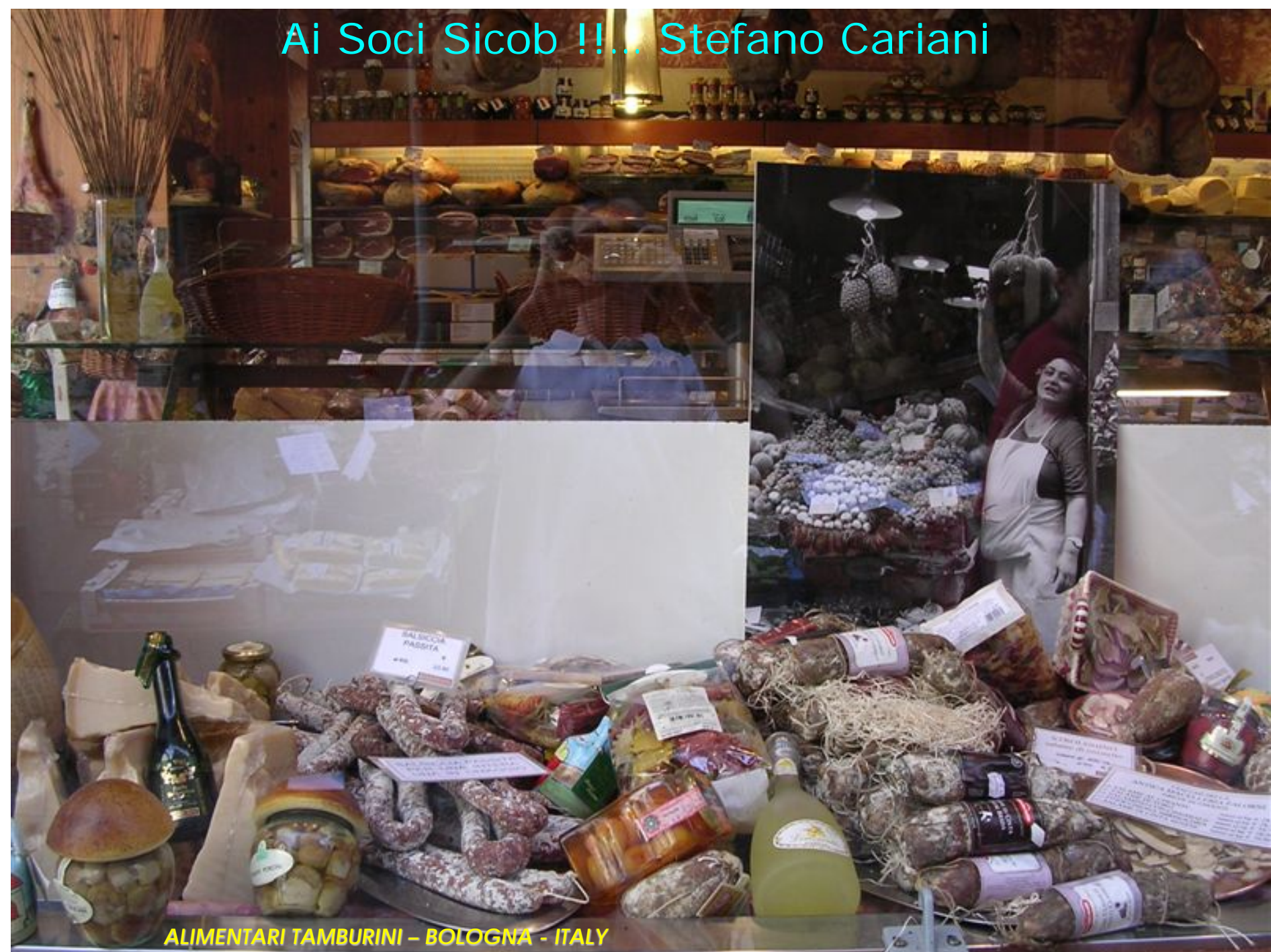
ALIMENTARI TAMBURINI – BOLOGNA - ITALY