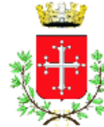
Comune di Pisa