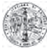
SIC Società Italiana di Chirurgia 118° Congresso Nazionale